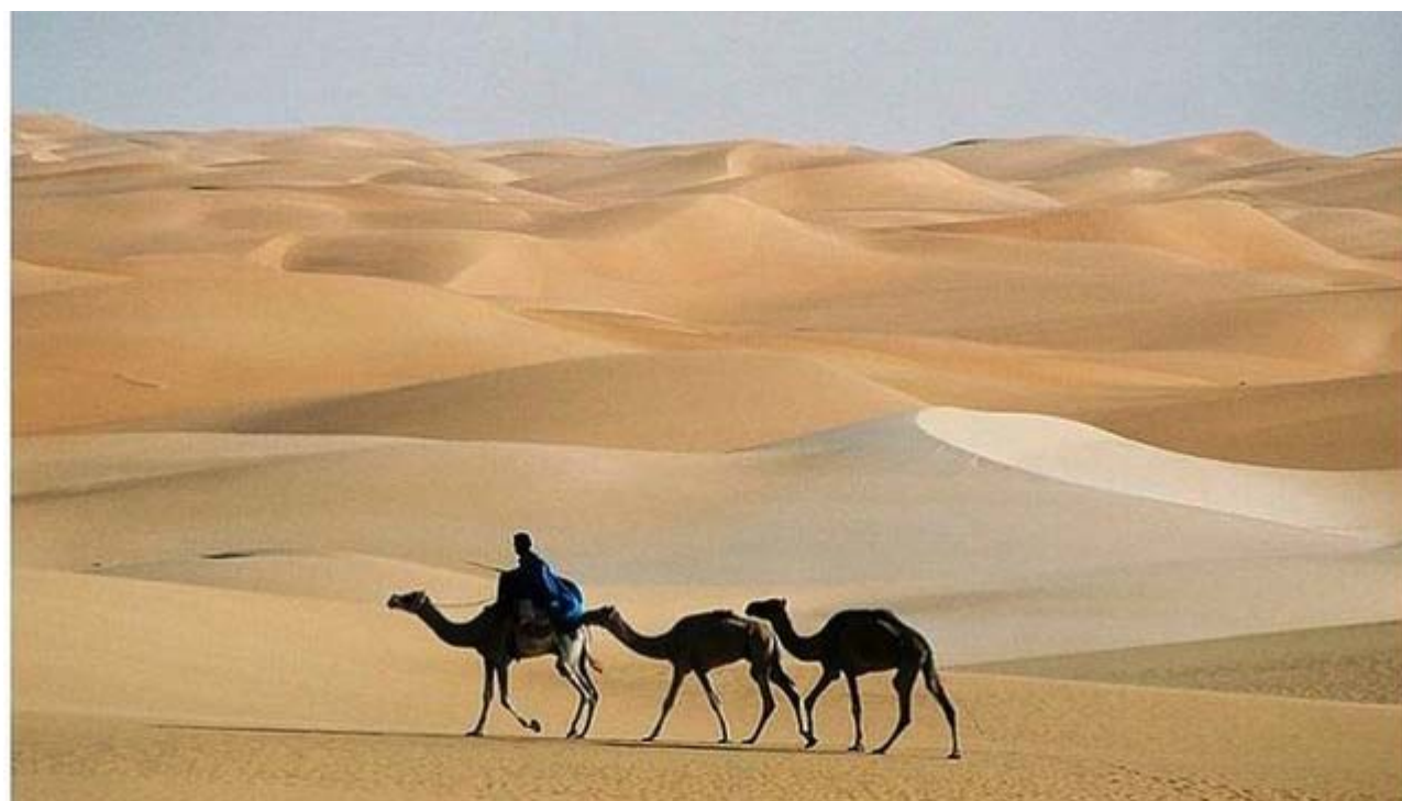
Desierto del Sahara

El cartel de la autovía lo dice bien claro: 'Desierto de Tabernas'. Pero no es un desierto, no encaja en ninguna de las dos grandes clases de desiertos: los de origen climático y los que son consecuencia de la intervención humana.